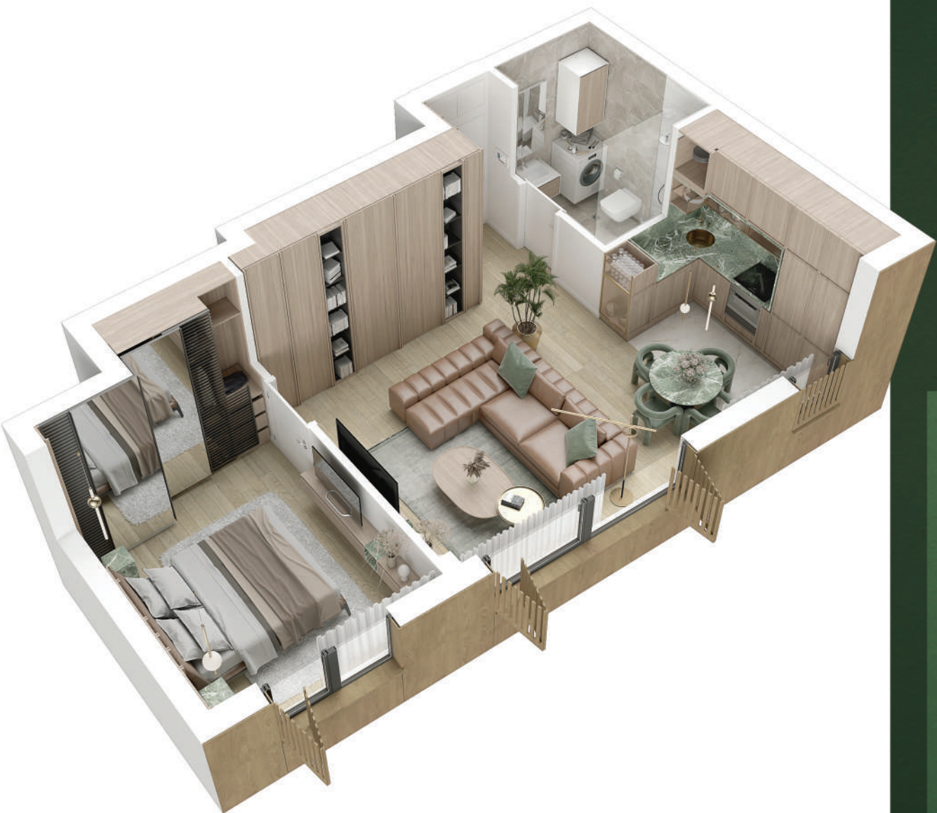
Struktura: DVOSOBAN STAN | Dostupan na: VISOKOM PRIZEMLJU.