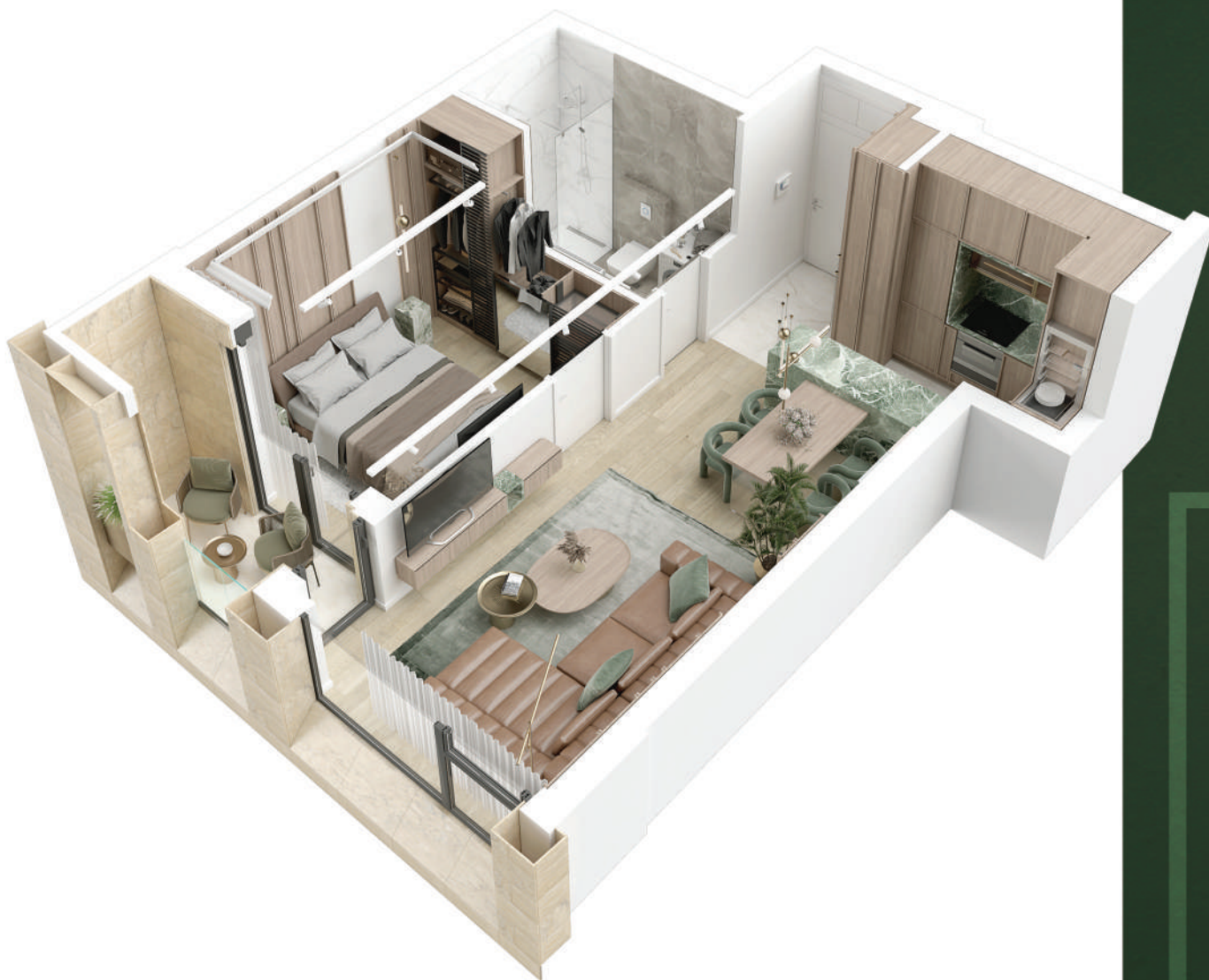
Struktura: DVOSOBAN STAN | Dostupan na: 1. SPRATU; 3. SPRATU.