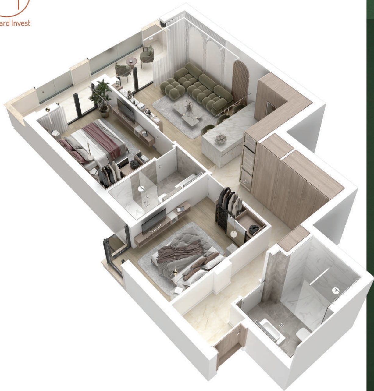
Struktura: TROSOBAN STAN | Dostupan na: VISOKOM PRIZEMLJU.